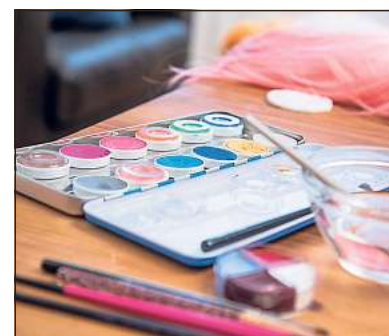
Mit Schminke zum perfekten Karnevals-Outfit: Aquafarbe ist dabei hautschonender als Farben auf Fettbasis.

Aus Sicht der Verbraucherschützer ist Aquafarbe hautschonender als Farben auf Fettbasis, da sie im Vergleich die Poren nicht so sehr verstopfen und mit Wasser und Seife leichter zu entfernen sind. Wer nicht nur seine Haut, sondern auch die Umwelt schonen will, sollte Glitzer und Schminke nicht einfach abwischen: Besser mit einem Papier Tuch abwischen und im Müll entsorgen. Denn die kleinen Teilchen könnten in Form von Mikroplastik ins Wasser fließen. (dpa)