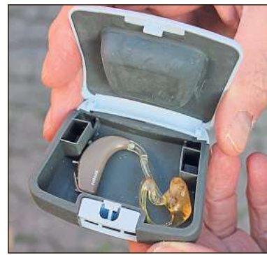
Hörgeräte wie dieses sammelt die KAB ebenfalls für die Organisation „Brillen weltweit“.