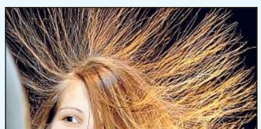
Spülungen oder Öle helfen bei fliegenden Haaren.