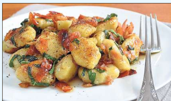
Angebraten werden die frischgekochten Gnocchi in Salbei-Butter.