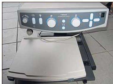
Außergewöhnlich , aber gern gesehen: Vor drei Jahren hat eine Person dieses nicht mehr benötigte, computergesteuerte Lesegerät gespendet. Denn auch technische Hilfsmittel können bei der KAB-Brillensammlung abgegeben werden.